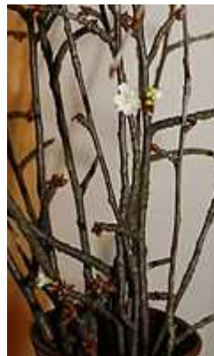
Blüte am 23. Dezember (6)

Schneidet mehrere (Es klappt nicht immer!) Äste ab, die sichtbare kleine Knospen haben. Geeignet sind Zweige von Kirsch- oder Apfelbäumen.