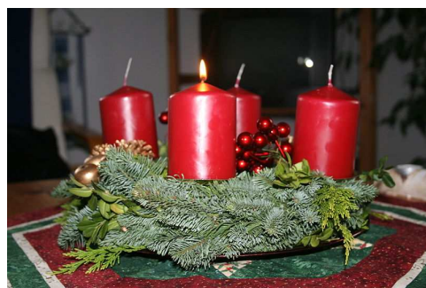
Adventskranz am 1. Advent

Den Adventskranz gibt es erst seit rund 150 Jahren. Im Jahr 1838 war es Johann Heinrich Wichern (ein bekannter evangelischer Theologe und Pädagoge), der zunächst einige Kerzen auf ein Holzkreuz steckte und in der Adventszeit nach und nach anzündete. Im Jahre 1860 wurden erstmalig grüne Zweige um das Kreuz gewickelt und der Adventskranz, wie wir ihn heute kennen, war entstanden.